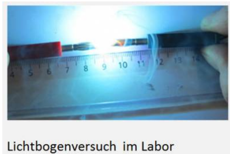
Bild zeigt eine Lichtbogen simulation mit einem auf 5A begrenzten Netzteil und zwei laborüblichen Steckkontakten. Der Lichtbogen lässt sich wie ein Streichholz anzünden und bleibt mit ca. 6mm stabil stehen, solange bis man die Kontakte aufgrund der Wärmeentwicklung freiwillig loslässt.

Aus benachbarten Ingenieurwissenschaften wie der Photovoltaik oder der Mittelspannungstechnik sind verschiedene Lösungen zur Lichtbogendetektion bekannt. Die meisten Verfahren verwenden dazu Informationen aus dem Frequenzbereich, da sich ein Lichtbogen in vielen Fällen als breitbandiger Störer bemerkbar macht. Alle Verfahren haben den Nachteil von zusätzlichem Hardwareaufwand bzw. konnten noch nicht nachweisen in allen Fällen über die Fahrzeuglebensdauer zuverlässig zu funktionieren.